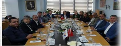
uygulan KDV'nin kalkması gerektiğini dile getirerek, ayrıca sağlık sektöründeki