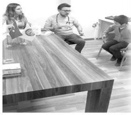
Çalışmada öğrenci ve veliler ile birebir