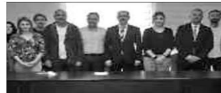
Körfez Ticaret Odası'nda, girişimci adaylarına yönelik düzenlenen ek bilgilendirme toplantısına büyük ilgi gösterilmesi dikkat çekti.

Körfez Ticaret Odası yönetim kurulu, meclis ve komite üyeleri ile birlikte ekip ruhuyla bütünlük içinde çalışmaya devam ediyor. Gidilmeyen üye kalmayacak düşüncesiyle hareket eden oda üyeleri Nisan Ayı'ndan bu yana 700'e yakın üye ziyareti gerçekleştirdi. HABERİ 2.SAYFADA