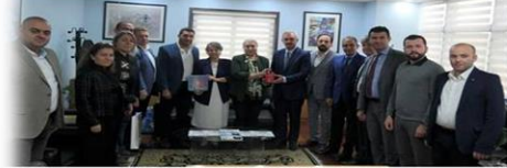
Ördekli sorunlar ve çözüm önerilerinin tartışıldığı toplantıya katılan Gebze Ticaret

öcali Ticaret Odası ve Körfez Ticaret Odası Meslek Komite Başkan ve üyelerinin katılımıyla, eğitim ve sağlık alanında faaliyet gösteren 23. Meslek Komite Başkan ve üyeleri, müşterek toplantılarını gerçekleştirdiler.