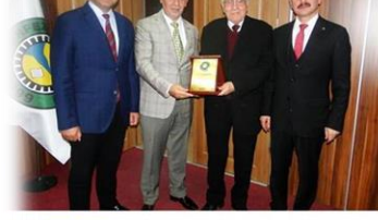
Körfez Ticaret Odası Ekim Ayı Meclis Toplantısı ve komiteler müşterek toplantısı çok yoğun bir katılımla gerçekleştirildi.

Körfez Ticaret Odası Ekim Ayı Meclis Toplantısı ve komiteler müşterek toplantısı çok yoğun bir katılımla gerçekleştirildi. Yapılan toplantıların ardından komiteler müşterek yemek organizasyonunda bir araya geldiler.