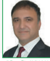
Güngör AYHAN (Meclis Başkanı)