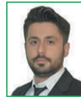
İnan GÜNAY (Meclis Üyesi)