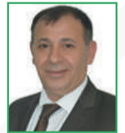
Kemal ŞENGÜL (Meclis Üyesi)