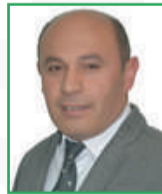
Hasan DEMİRTAŞ (Meclis Üyesi)