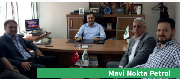
Mavi Nokta Petrol