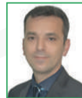
Şenol ÖRNEK (Meclis Üyesi)