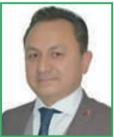
Erdal YAVUZ (Meclis Üyesi)