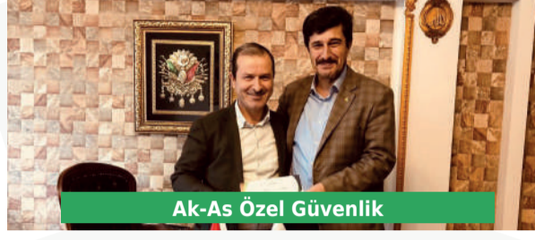
Ak-As Özel Güvenlik