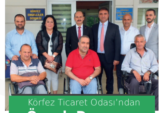
Körfez Ticaret Odası'ndan Örnek Davranış

Körfez Ticaret Odası yönetim kurulu üyeleri Engelliler Haftası kapsamında ziyarette buldukları Körfez Engelliler Derneğinin en büyük sıkıntılarının dan birinin tartılamamak olduğunu söyleyince oda yönetimi harekete geçerek kendi üyesine engellilerin tartılabildiği tartı yaptırdı.