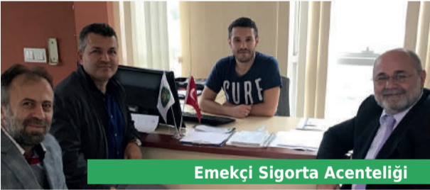
Emekçi Sigorta Acenteliği