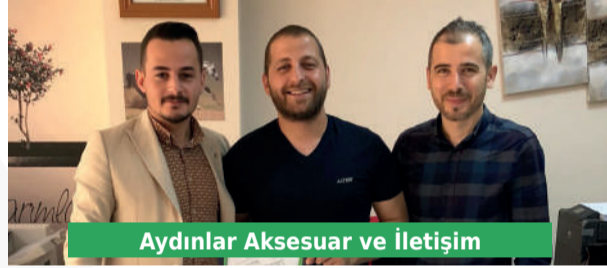
Aydınlr Aksesuar ve İletişim