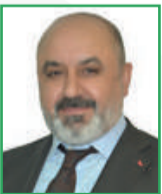
Latif HÜRTÜRK (Meclis Üyesi)