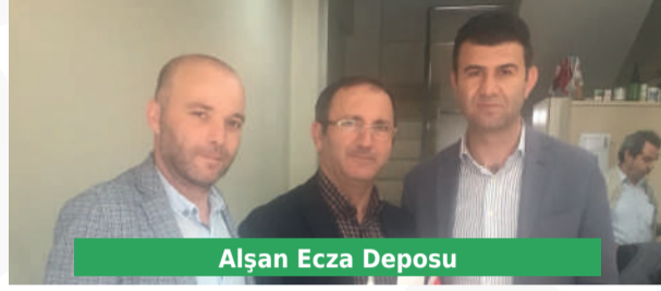
Alşan Ecza Deposu