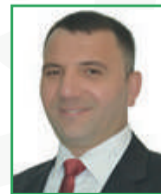
Mustafa ALTUN (Meclis Üyesi)