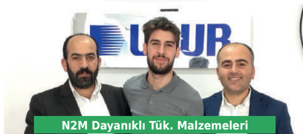
N2M Dayanıklı Tük. Malzemeleri