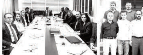
5. Komite toplantılarını bundan sonra daha kapsamlı gerçekleştirecek.

ştırma ve pazarlama faaliyetleri kapsamında Körfez'de üretim yapan üreticilerin ortak beklentileri olan pazarlama desteği ve pazar ara-