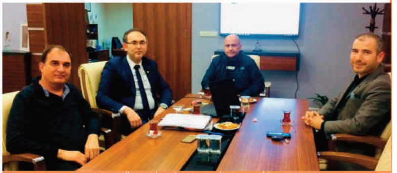
Ihracat komisyonu toplantısı yapıldı

vereceğimiz eğitimlerle ilgili MARKA'ya geçtiğimiz aylarda hazırlanan projemiz MARKA tarafından onaylandı ve gerçekleştirilen protokolle süreci başlattık. Bu proje kapsamında vereceğimiz eğitimlerin ücretlerinin büyük bir kısmı MARKA tarafından karşılanacak ve MARKA ile iş birliğimiz bu kapsamda devam edecek. MARKA odamız adına eğitimlerle ilgili görüşmeleri gerçekleştirerek ücretlendirme konusunu ve satın alma konularını kendi bünyesinde gerçekleştirecek. Böylelikle odamızda verdiğimiz eğitimler çok daha kaliteli hale gelecek ve üyelerimiz bu eğitimlerimizden çok daha fazla verim almış olacak" dedi.